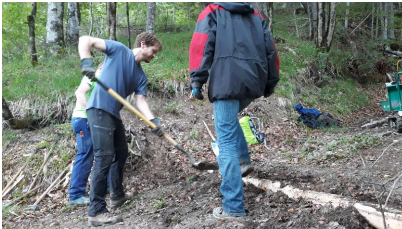
Teilnehmer des Bergwaldprojekts beim Wegbau