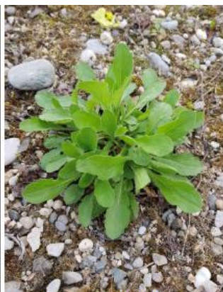
Berufkraut im blütenlosen Zustand

Gemeinsam gegen die invasiven Neophyten!