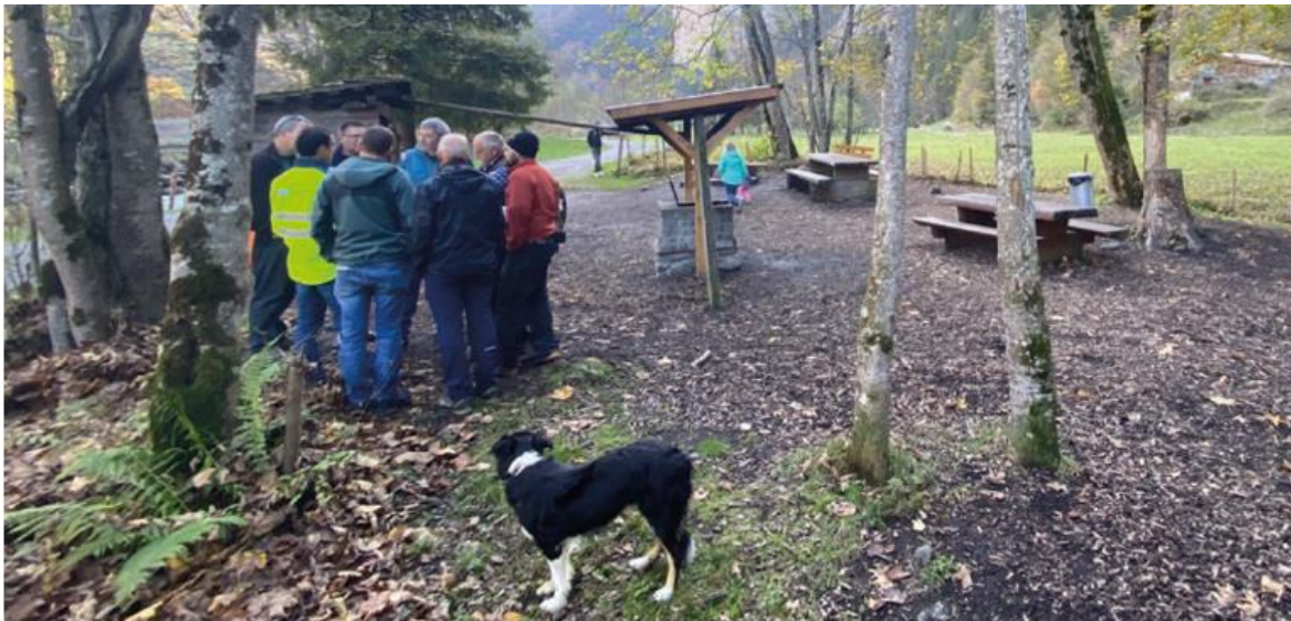
Begehung und Besprechung Massnahmenkonzept mit Vertretern der SK Lauterbrunnen am 26. Oktober 2022

Nach der Beschaffung und Erarbeitung der wichtigen Grundlagen, ersten Workshops und einer gemeinsamen Geländebegehung von Begleitgruppe und Fachausschuss, mit entsprechenden Rückmeldungen und Empfehlungen, ist ein zentrales Planungsinstrument, das Massnahmenkonzept, erarbeitet worden. Es basiert auf den Grundlagen des Geschiebehaltstudie, der Ermittlung ökologischer Potenziale, Zustandserhebung der Hochwasser-Schutzbauten, der Gefahrenbeurteilung der Seitenerosionen und dem Leitbild. Das Konzept berücksichtigt in hohem Masse auch die Interessen der Landwirtschaft, Naherholung und Wasserversorgung mit Wasserkraftnutzung zu ersetzen. Der erste Entwurf des GRP Lüttschine wird voraussichtlich Ende Oktober 2024 vorliegen. Er geht anschliessend zur Stellungnahme an die Fachstellen von Bund und Kanton.