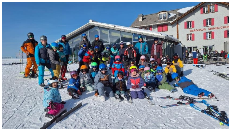
Die Unterstufe zusammen mit der 1. Klasse beim ersten von drei Skitagen auf dem Männlichen. Wetter: Bombastisch!

Am Freitag, 16. Januar, durfte die Oberstufe das Super-G Rennen der int. Lauberhornrennen besuchen. Das Wetter passte hervorragend und der grossartige Ausflug wurde mit dem Podestplatz von Franjo von Allmen natürlich noch zusätzlich versüsst.